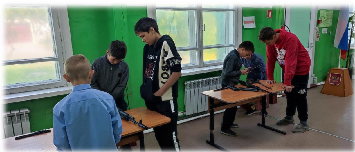
С удовольствием ребята 1-3 отрядов приняли участие в соревнованиях «Мы - будущие защитники Отечества»