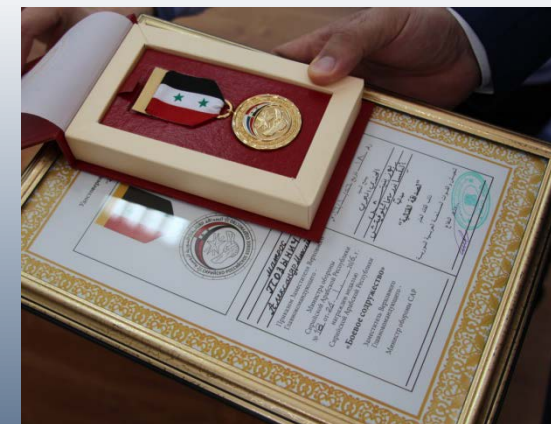
Награда от Правительства Сирийской Арабской Республики