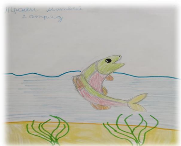
Посетили филиал Кроноцкого заповедника.