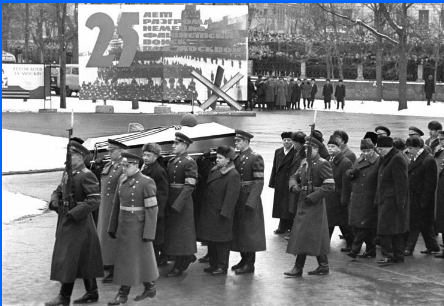
Захоронение праха Неизвестного солдата у Кремлевской стены, 3 декабря 1966 года