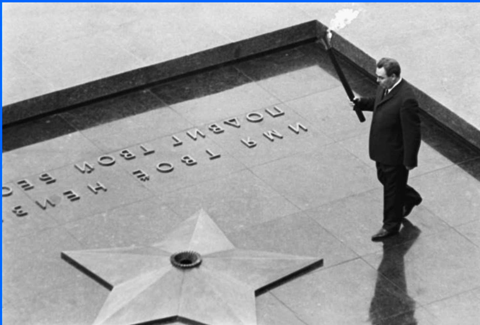
Генеральный секретарь ЦК КПСС Леонид Брежнев зажигает Вечный огонь на "Могиле Неизвестного солдата", 1967 год