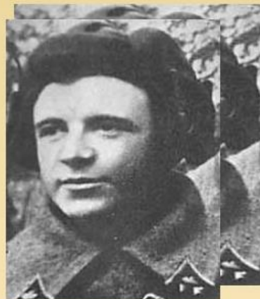
Дмитрий Федорович Лавриненко

Его именем названа школа № 28 и улица в станции Бесстрашная, улицы в Волоколамске, Армавире и Краснодаре. Но памятника ему нет в стране до сих пор.