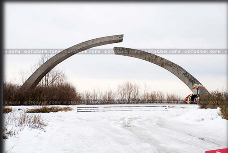
Монумент "Разорванное кольцо" в честь прорыва блокады Ленинграда на Ладожском озере

Блокада Ленинграда — военная блокада немецкими, финскими и испанскими войсками с участием добровольцев из Северной Африки, Европы и военно-морских сил Италии во время Великой Отечественной войны города Ленинграда. Длилась блокада с 8 сентября 1941 года по 27 января 1944 года— 872 дня.