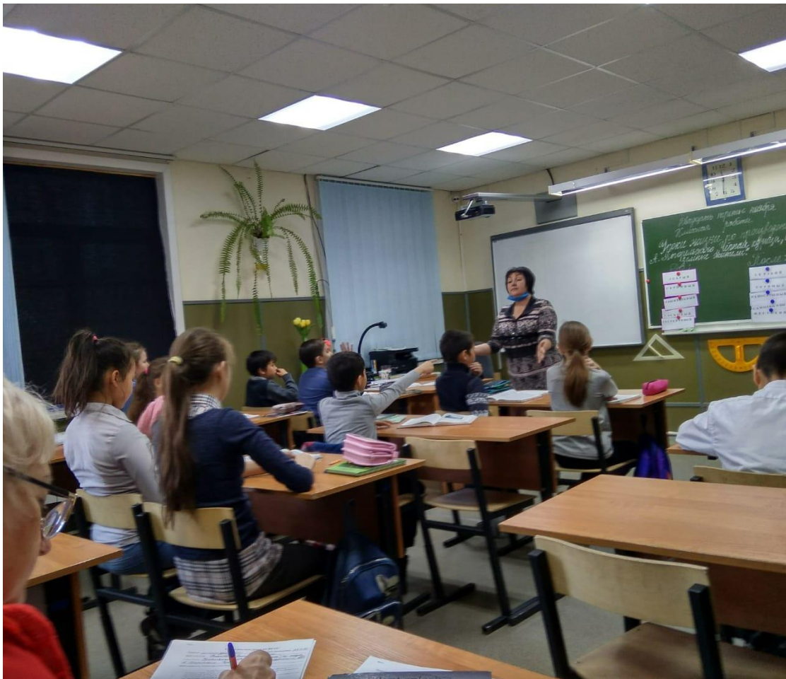
Фрагмент урока по составлению характеристики главного героя произведения