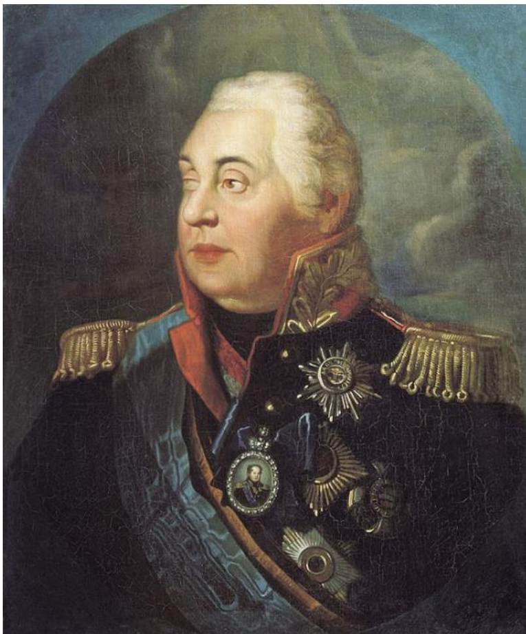
Михаил Илларионович КУТУЗОВ (1745 – 1813)

Прославленный русский полководец. Участник штурма Измаила (1790 год).