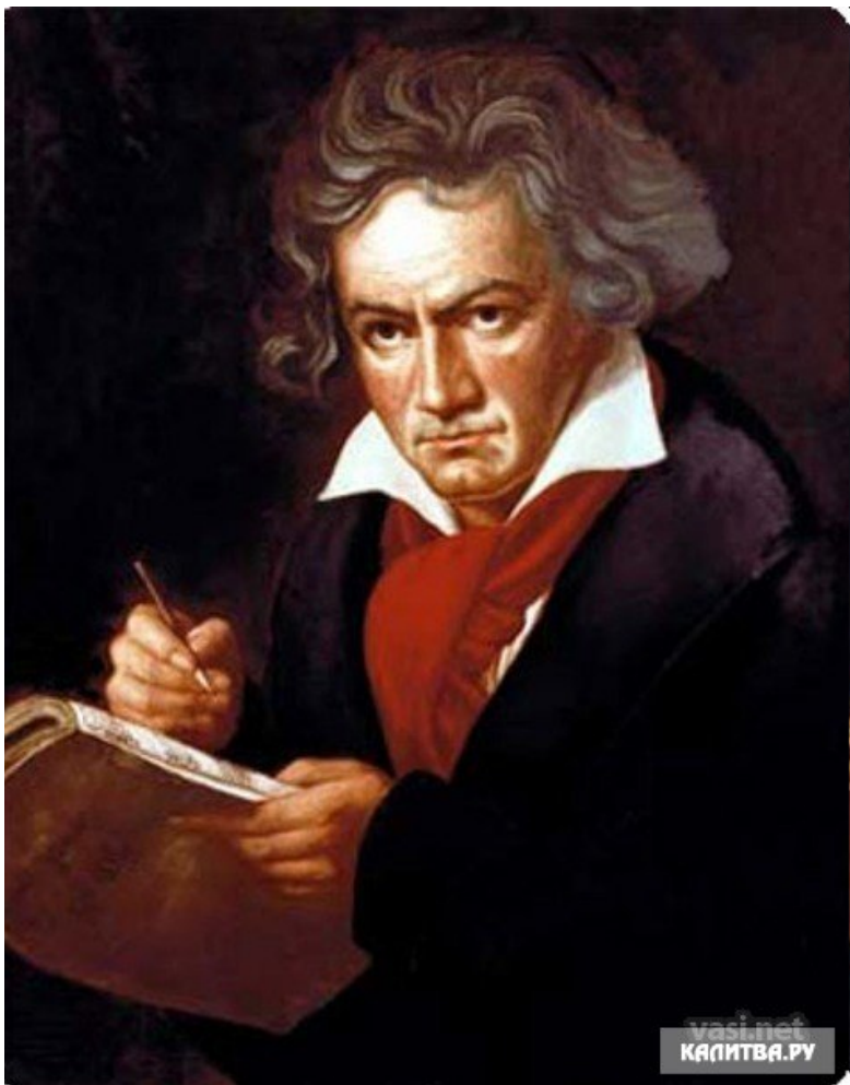
Людвиг ван БЕТХОВЕН (1770 – 1827)

Великий немецкий композитор и пианист, представитель «венской классической школы».