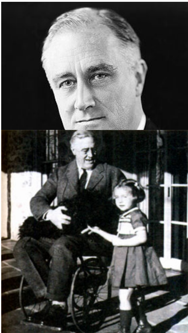
Франклин Делано РУЗВЕЛЬТ (1882 – 1945)