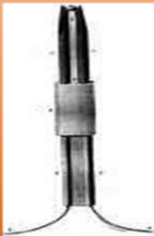
Электросвеча П.Н. Яблочкова