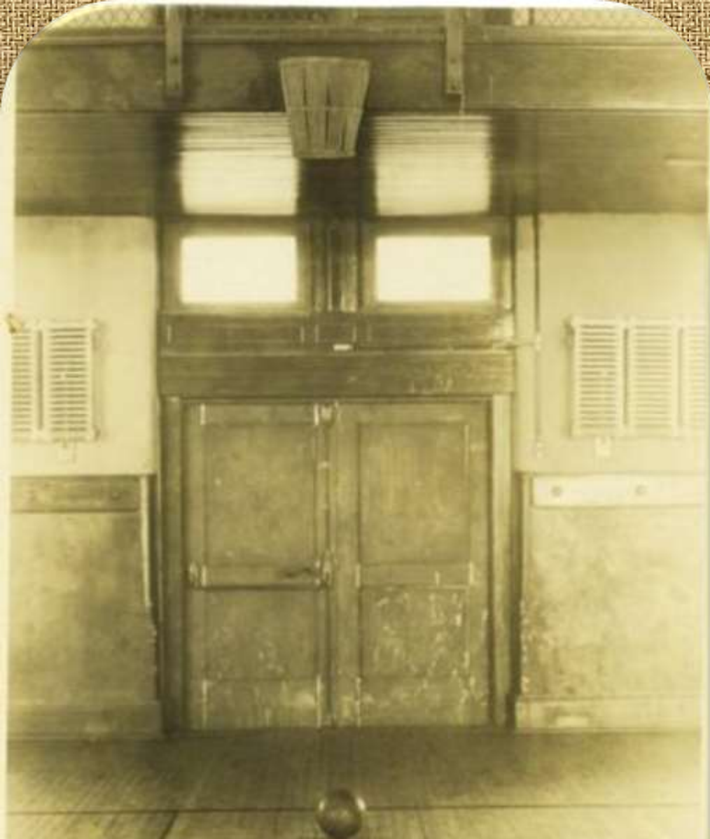
Первый баскетбольный зал, колледж молодежи Спрингфилд, Массачусетс. Корзина для персиков прикреплена к балкону