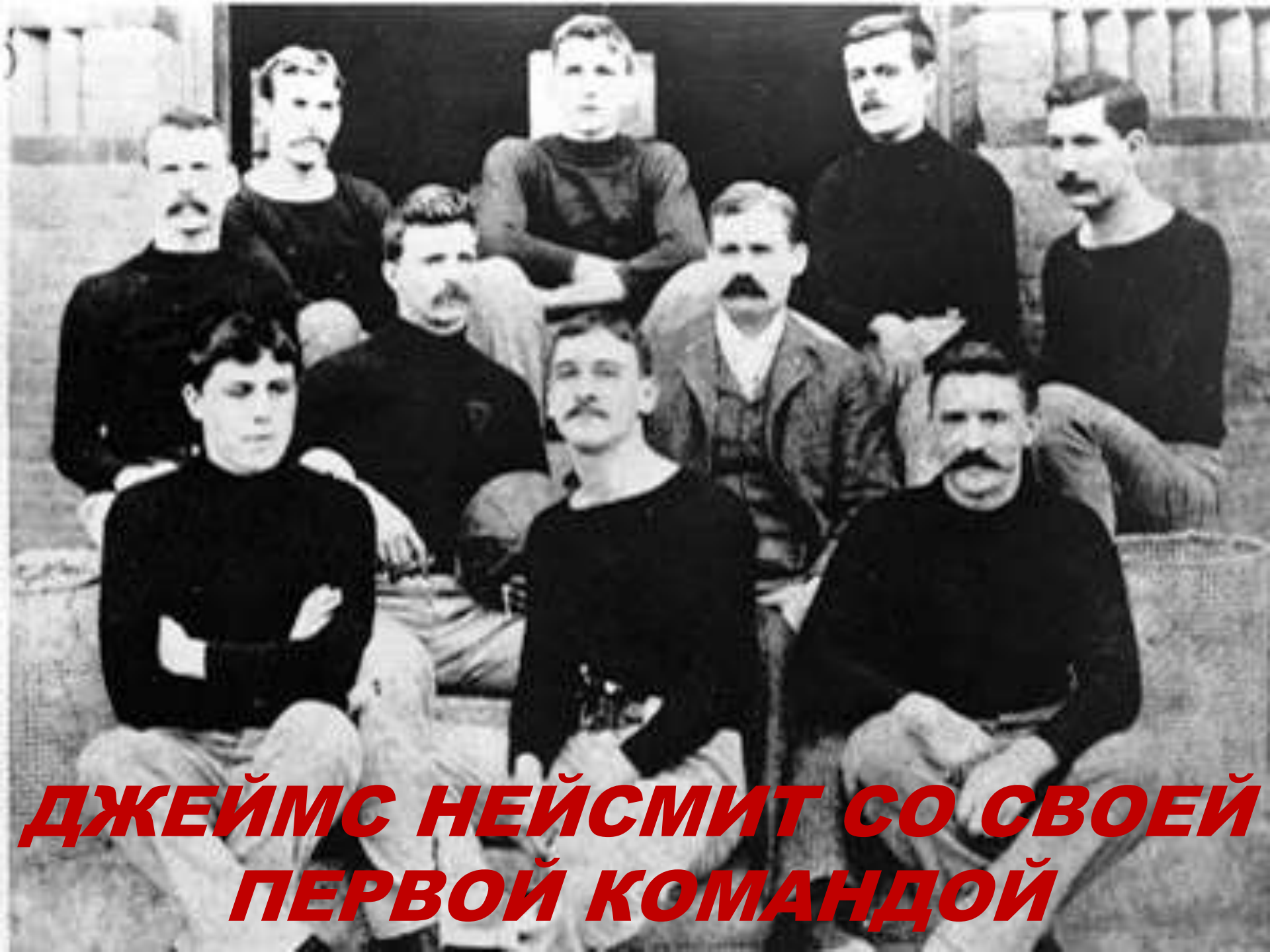
ДЖЕЙМС НЕЙСМИТ СО СВОЕЙ ПЕРВОЙ КОМАНДОЙ